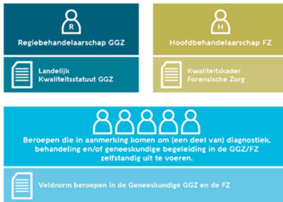
Figuur: Verhouding Veldnorm tot Landelijk Kwaliteitsstatuut GGZ en Kwaliteitskader Forensische Zorg

Deze veldnorm is het startpunt en het sluitstuk van veel andere afspraken over kwaliteit. Deze zijn vastgelegd in richtlijnen en veldnormen die beschreven wat kwaliteit van zorg is. Op basis van deze bestaande normen heeft Akwa GGZ een overzicht gemaakt van de beroepen die een rol hebben in ggz en fz. Op basis van objectieve kwaliteitscriteria is vervolgens bepaald welke van die beroepen in aanmerking komen om (een deel van) diagnostiek, behandeling en/of geneeskundige begeleiding zelfstandig uit te voeren. Daarmee is deze veldnorm ook weer input voor andere veldnormen en richtlijnen die zorg beschrijven. Met deze veldnorm borgen wij dat iedereen dezelfde basisnormen hanteert bij het inzetten van beroepen in de ggz en fz.